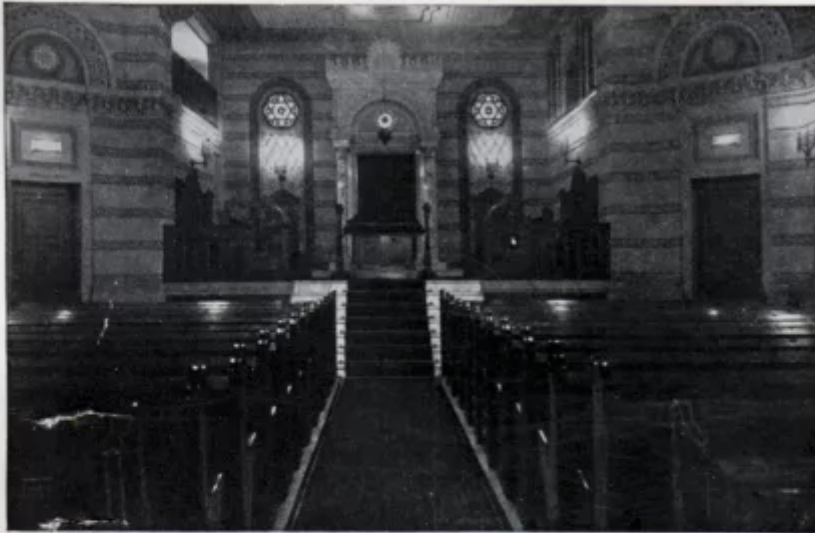
A Pesti Izr. Nőegylet Orsz. Ceányarvagázának temploma.